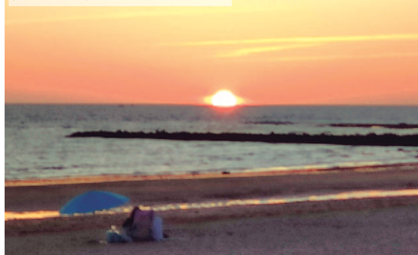
Atardecer sobre el mar en Chipiona (Cádiz)

Aún tienes la oportunidad de disfrutar de los atardeceres gitanos, de los más bonitos de España. Chipiona y tú.