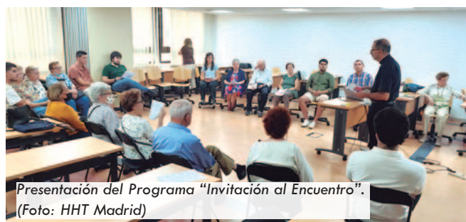
Presentación del Programa “Invitación al Encuentro”.

Destacar, también, el papel de los “Jóvenes acompañantes”, personas jóvenes voluntarias, que empaticen con los mayores, sus procesos, pérdidas y necesidades, y que quieran compartir vida, ser más conscientes y acompañar.