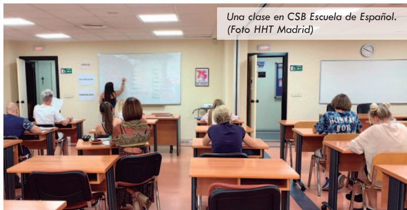
Una clase en CSB Escuela de Español.

Además, cabe destacar que, desde marzo de 2022, muchos de estos refugiados proceden de Ucrania, como consecuencia de la invasión rusa de este país.