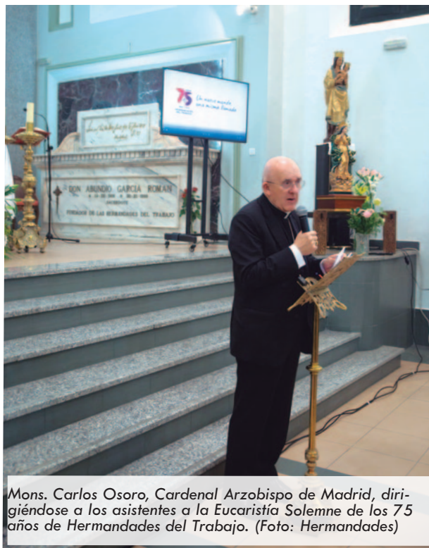
Mons. Carlos Osoro, Cardenal Arzobispo de Madrid, dirigiéndose a los asistentes a la Eucaristía Solemne de los 75 años de Hermandades del Trabajo.