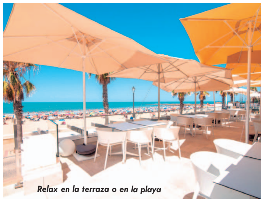
Relax en la terraza o en la playa