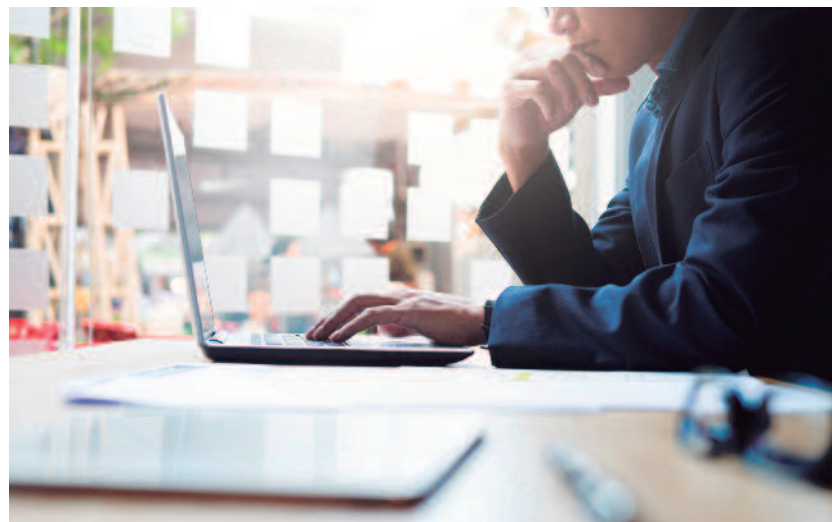
Prestaciones, desempleo y finalizaciones de contratos, entre las principales preocupaciones de los trabajadores.

El Centro de Madrid ampliará el Servicio de Asesoría Jurídica y Laboral gratuito hasta el 30 del próximo mes de septiembre tras evaluar, junto a los asesores y el Consejo del Centro, la conveniencia de seguir apoyando a los trabajadores y sus familias en todas las dudas que las distintas situaciones derivadas de la pandemia del covid-19 han generado, tanto a nivel laboral como jurídicas en general