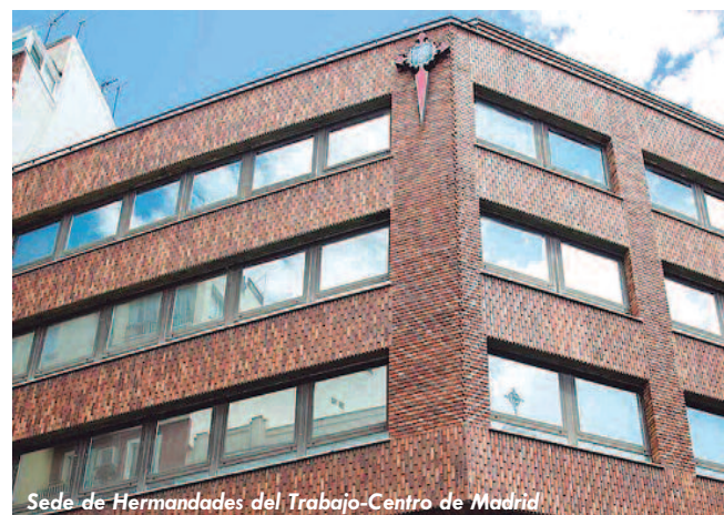
Sede de Hermandades del Trabajo-Centro de Madrid

Los órganos de gobierno vienen trabajando con otras entidades para poner en marcha nuevos proyectos sociales, de los que os iremos informando puntualmente.