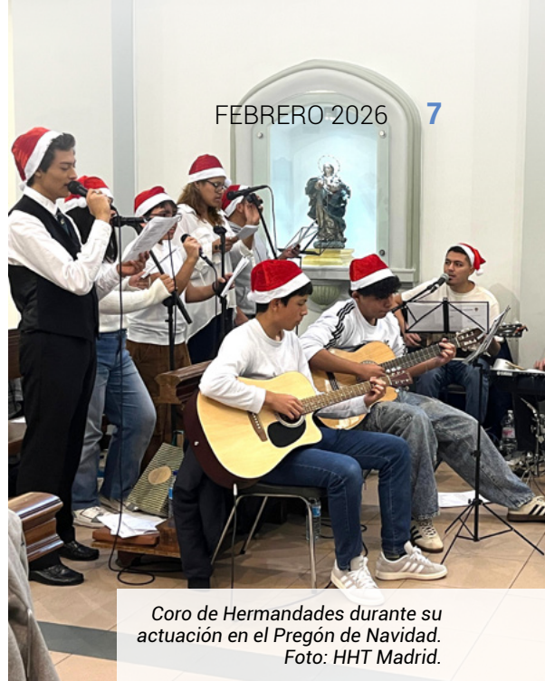
Coro de Hermandades durante su actuación en el Pregón de Navidad.