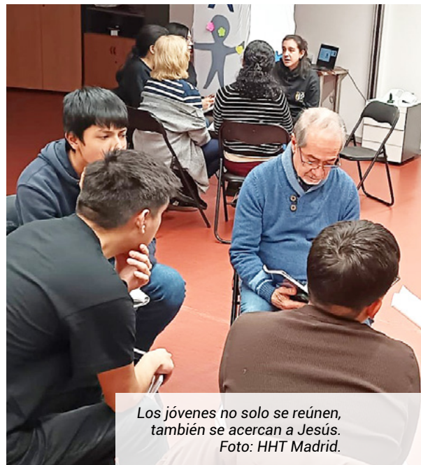
Los jóvenes no solo se reúnen, también se acercan a Jesús.