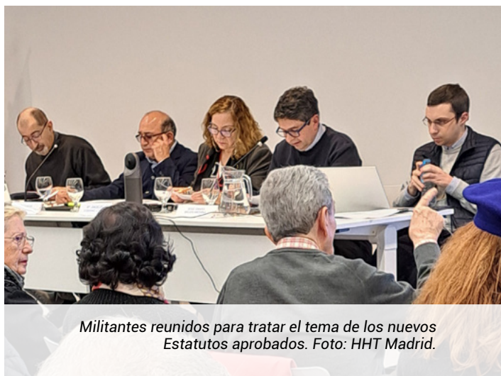
Militantes reunidos para tratar el tema de los nuevos Estatutos aprobados.