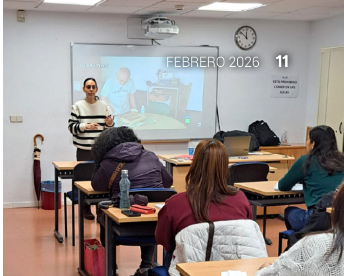
Una de las clases del Curso de Atención Sociosanitaria a Personas Dependientes en Instituciones Sociales.

Los Estatutos están a vuestra disposición en la página web ( www.hhtmadridd.com ) en formato PDF digital y, en papel, en la sede, en la calle Raimundo Lulio, 3. También, en la página 15 de esta revista tenéis un artículo en el que se explican en profundidad.