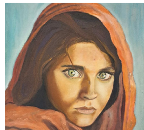
Uno de los cuadros de la Exposición por el Día Internacional de la Mujer, de Ulpiano Coello. Representa a Sherbat Gula.

Lunes, 2, inauguración , con un coloquio con representantes de Pastoral del Trabajo. Clausura el 6 de marzo . Se contará con testimonios en primera persona de mujeres en relación a "la esperanza". En colaboración con Iglesia por el Trabajo Decente de la Archidiócesis de Madrid.