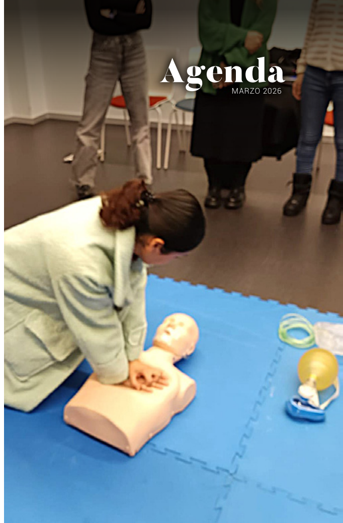
Taller de primeros auxilios.

Se inició con éxito la 4ª edición con 15 plazas, el 2 de febrero de 2026, en turno de mañana (8:30-13:30h). El 9 de marzo comienza a 5ª ed. en turno de tarde (16:00-21:00h). Deseamos a alumnas/os mucho ánimo en esta nueva etapa de formación, mirando siempre hacia el futuro, la justicia y la dignidad en el mundo del trabajo.