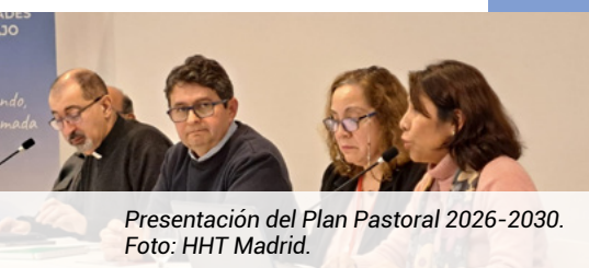
Presentación del Plan Pastoral 2026-2030.