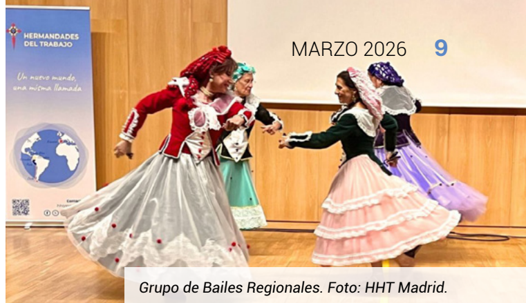
Grupo de Bailes Regionales.