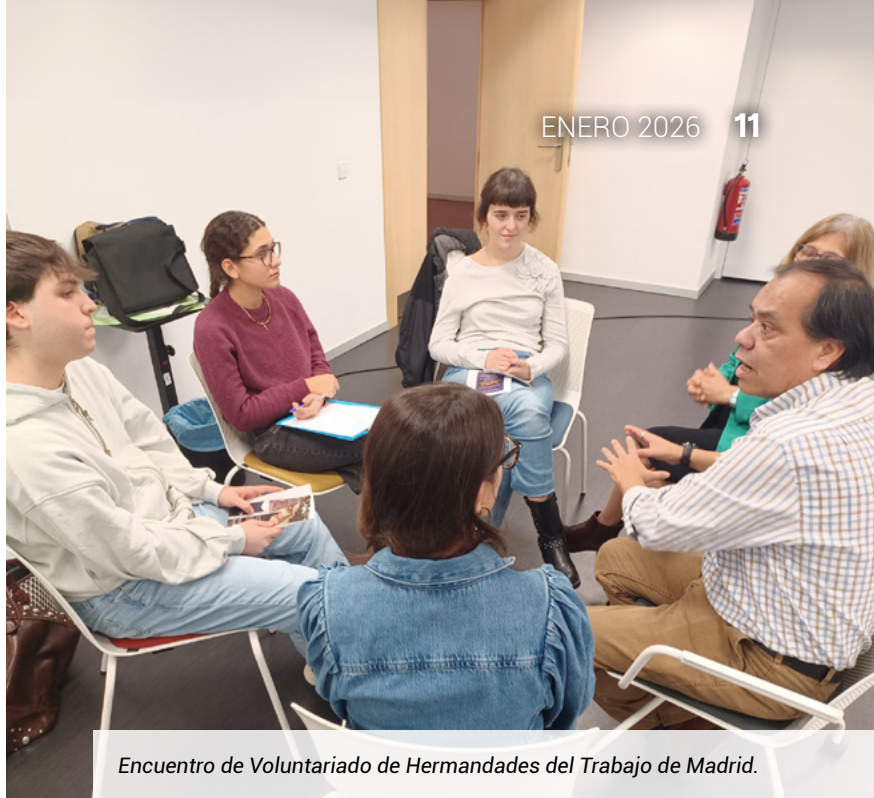
Encuentro de Voluntariado de Hermandades del Trabajo de Madrid.

Queremos agradecer la labor del voluntariado, que contribuye a hacer posible la obra de nuestra institución: el servicio a la sociedad y colaborar en la dignidad y la promoción de los trabajadores. Un año más hacemos honor a nuestro lema "unos por otros y Dios por todos".