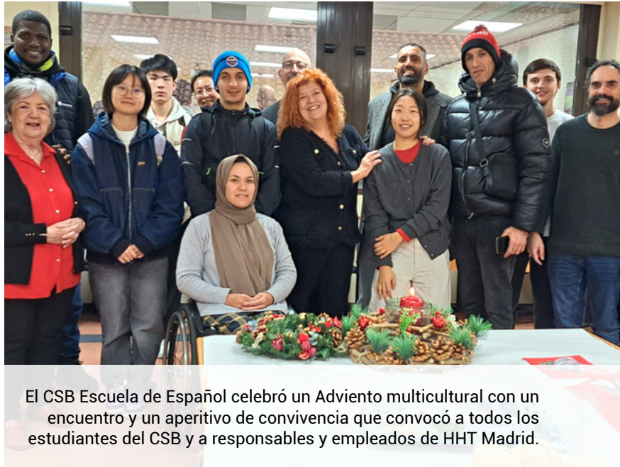
El CSB Escuela de Español celebró un Adviento multicultural con un encuentro y un aperitivo de convivencia que convocó a todos los estudiantes del CSB y a responsables y empleados de HHT Madrid.

Este servicio de caridad y obra social continua diariamente con la atención a refugiados que asisten a nuestro CSB Escuela de Español a través de la preparación y entrega de refrigerios.