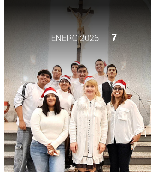
Coro Juvenil de HHT Madrid tras su actuación en el Pregón de Navidad.

Info: info@hhtmadril.com | 639871402 (teléfono y WhatsApp)