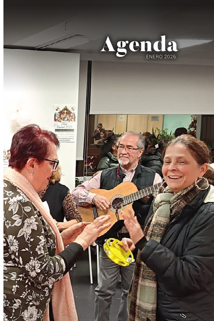
Convivencia navideña en el Encuentro de Trabajadores Inmigrantes y Familias Trabajadoras.