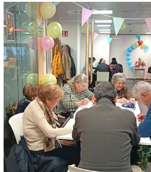
Encuentro navideño solidario organizado por Café Joven.

departamentoapostolico@hhtmadril.com | 639 871 402 (teléfono y WhatsApp)