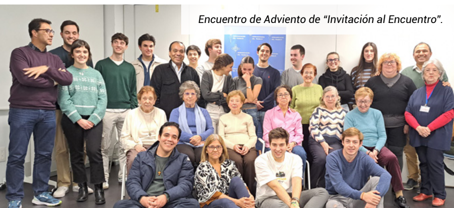
Encuentro de Adviento de "Invitación al Encuentro".

Info: info@hhtmadrid.com | 914 473 000 | 639 532 034 (teléfono y WhatsApp).