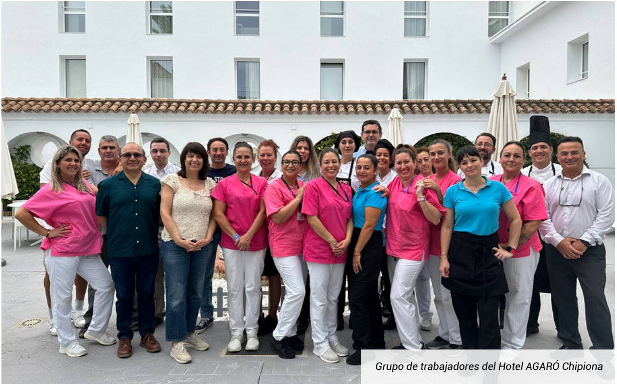
Grupo de trabajadores del Hotel AGARÓ Chipiona