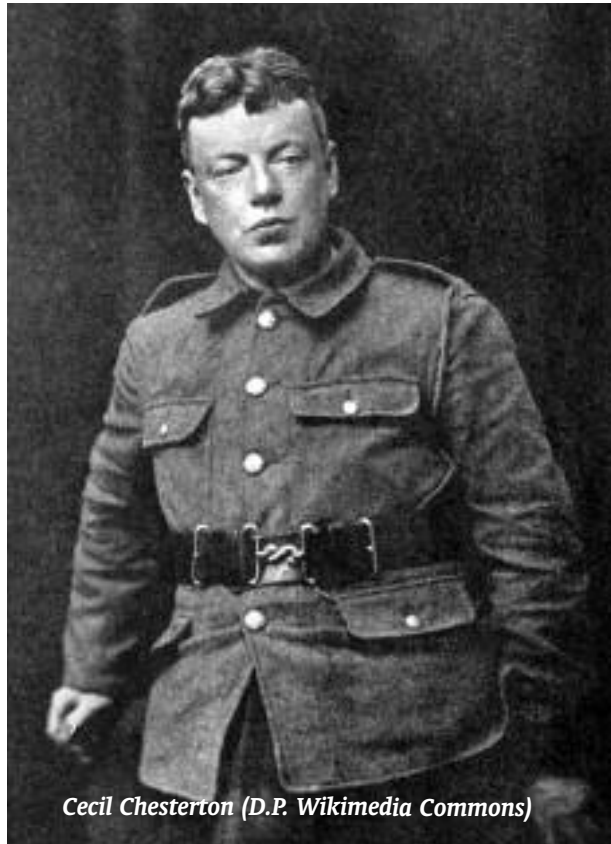
Cecil Chesterton

Chesterton dedica a Cecil un capítulo entero de su Autobiografía que se titula Proceso a la corrupción , todo un panegírico a Cecil, que, notamos, está escrito con profundísima admiración (y añoranza). Es importante adelantar que los Chesterton amaban con pasión su