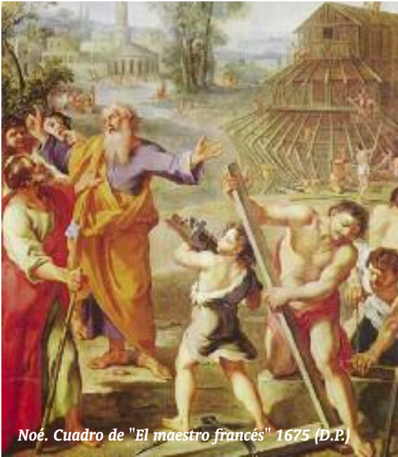
Noé. Cuadro de "El maestro francés" 1675 (D.P.)

Después de unas cuantas entregas centradas en los dos primeros seres humanos que aparecen en la Escritura –Adán y Eva–, ahora vamos a fijar nuestra atención en otro que viene algo después: Noé.