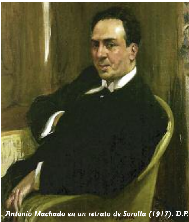
Antonio Machado en un retrato de Sorolla (1917). D.P.

No hay adjetivo que mejor defina la lírica de este poeta sevillano, lleno de delicadeza y honda espiritualidad forjada en treinta años de meditación en el paisaje castellano. Fue un poeta que buscó en la soledad, en el recuerdo, en las galerías de su alma el misterio de lo eterno. Vivía sencillamente, ensimismado en su rico interior, siempre en ciudades pequeñas y llevando una vida sin notoriedad aparentemente: Converso con el hombre que siempre va