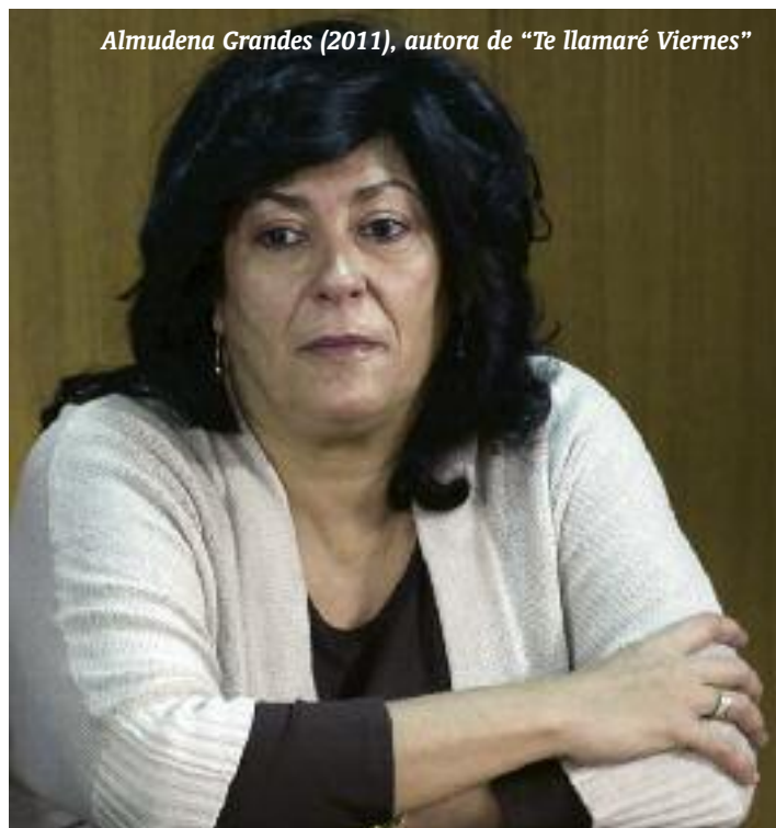
Almudena Grandes (2011), autora de “Te llamaré Viernes”

Veremos cómo la crisis afecta a los comerciantes “de siempre” del barrio (muchos han cerrado, otros lo están pasando mal), a profesionales de alto poder adquisitivo (que ya no