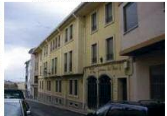
(BEJIS - CASTELLÓN)

RESIDENCIA "LOS CLOTICOS" Sierra de Espadán