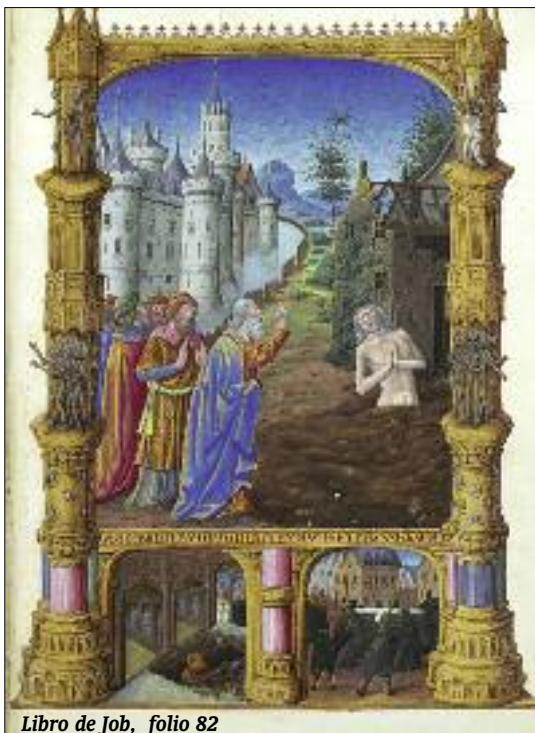
Libro de Job, folio 82

Como hemos dicho, lo que se describe está basado muy probablemente en una mezcla de fenómenos naturales, que incluiría al menos una erupción volcánica y una tormenta. Además, el relato probablemente esté entreverado con la liturgia del Templo de Jerusalén, donde el sonido de las trompetas y el humo del incienso podían inducir en el fiel un sentimiento o una sensación de «temor sagrado». En todo caso, lo que el creyente descubre en el relato es la presencia tremenda y fascinante de Dios, los dos rasgos que, según el teólogo y erudito alemán Rudolf Otto, caracterizan «lo Santo».