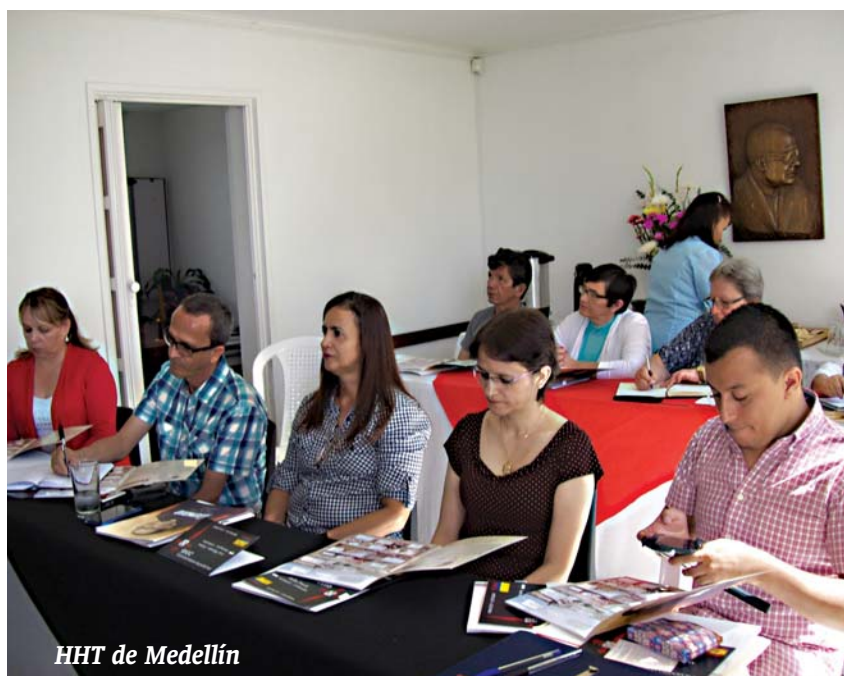
HHT de Medellín