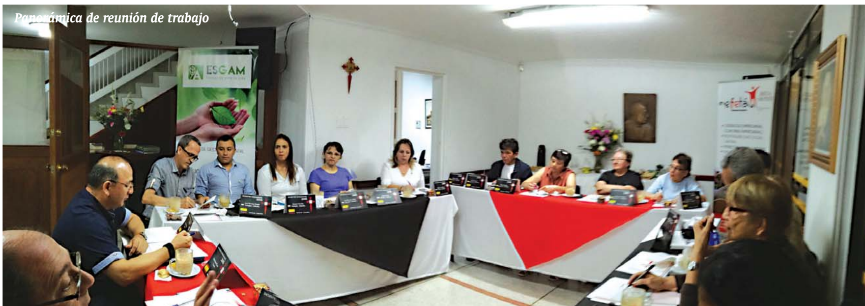
Panorámica de reunión de trabajo