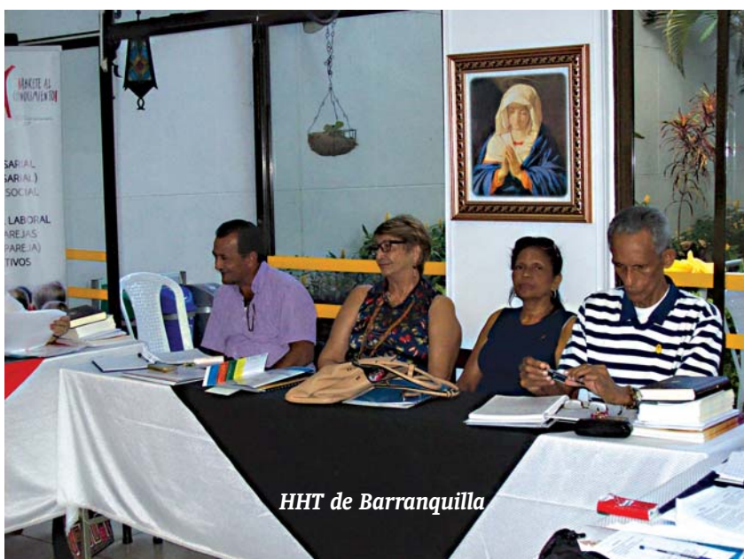
HHT de Barranquilla

Finalizando ya, comentaros que tuvimos el retiro en torno a la figura de don Abundio con el apoyo documental del comic, oraciones y celebraciones de la Eucaristía en las que ponemos una y otra vez en manos de Dios y bajo la intercesión del siervo de Dios, don Abundio, llegar a los trabajadores y que la vocación a colaborar en la obra de Hermandades golpee el corazón y la mente de muchos para fortalecer los centros de HHT en esta aventura. Por último, la entrevista con Monseñor Ricardo Tobón, un encuentro celebrado en un clima muy cordial y cariñoso, donde debemos acentuar el valor y conocimiento del arzobispo de Medellín por la Pastoral del Trabajo.