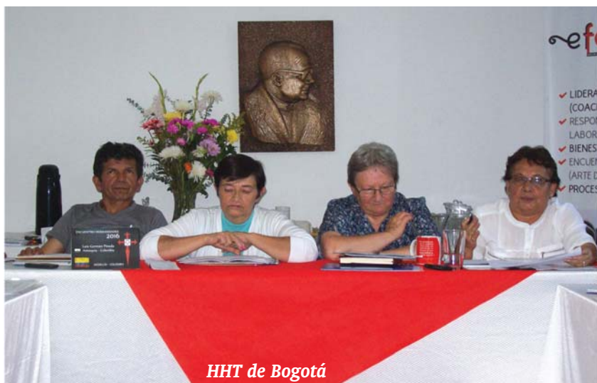
HHT de Bogotá