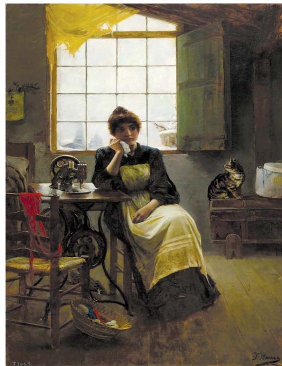
Sin Labor. Maura y Montaner (1891)

dos por contratos de duración determinada”, planeándolo en oposición a incrementar el “porcentaje de contratos indefinidos? Mucho me temo que el redactor de esta extrañamente redactada “medida para mejorar España” no vive en España, porque aquí, frente a lo que ocurre en otros países, un despido es y debe seguir siendo distinto y mucho más grave que no renovar un contrato temporal. Esto es así porque, guste o no, según el Tribunal Constitucional, el derecho al trabajo, que se recoge en el artículo 35.1 de nuestra Constitución, en su vertiente individual, se concreta en el “derecho a la continuidad o estabilidad en el empleo, es decir, en el derecho a no ser despedido sin justa causa”. Otra cosa muy distinta es que las empresas y las Administraciones Públicas recurran abusiva y fraudulentamente a la contratación temporal.