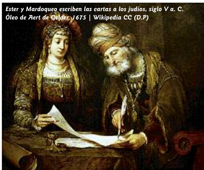
Ester y Mardoqueo escriben las cartas a los judíos, siglo V a. C. Óleo de Aert de Gelder, 1675

«Preguntaron a R. Yehosúa: “¿Por qué la mujer necesita perfumarse y el hombre no precisa perfumarse?” “El hombre fue creado de la tierra –les dijo–, y la tierra no se pudre nunca, pero Eva fue creada de un hueso. Por ejemplo, si dejas carne tres días sin sal, se pudre inmediatamente”. “¿Y por qué la mujer da tantas voces y el hombre no?” “Os pondré un ejemplo –les respondió–. Si llenas una olla de carne, no suena; cuando pones dentro un hueso, al momento hace ruido”. “¿Y por qué un hombre es fácil de apaciguar y la mujer no?” “El hombre fue creado de la tierra –les explicó–, y cuando echas en ella una gota de agua, al momento la absorbe; pero Eva fue creada de un hueso, y, aunque lo pongas en agua varios días, no se empapa”. “¿Y por qué es el hombre quien hace la petición de la mujer para casarse y no la mujer quien solicita en matrimonio al hombre?” “¿A qué puede compararse, a modo de ejemplo, este caso? –les dijo–. A uno que ha perdido algo y busca lo que ha perdido; pero el objeto per-