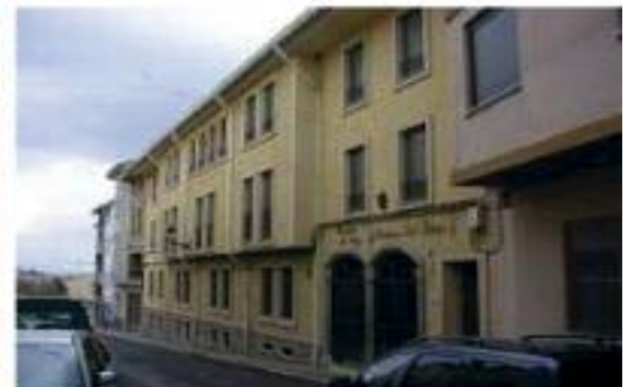
RESIDENCIA "LOS CLOTICOS" Sierra de Espadán