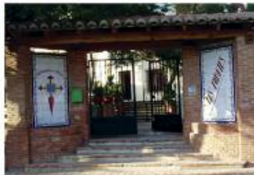
RESIDENCIA "LES FORQUES" Sierra la Calderona