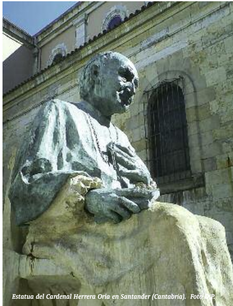
Estatua del Cardenal Herrera Oria en Santander (Cantabria).

Probablemente Ángel HERRERA ORIA, (Santander 1886-Madrid 28 de julio de 1968), nombrado Cardenal en 1965, por Pablo VI, es la figura eclesial más importante de la España del siglo XX, o una de las más grandes, incluidos los santos, súbitos o no tanto. Añadiría que es una personalidad civil y social de gran relieve. Un “grande de España” por sus aportaciones al bien común, (su lema fue: “pro bono communi”), a la Iglesia y a España. Sin embargo, es un DESCONOCIDO, o poco conocido, en la propia Iglesia, en la Sociedad, política y civil, y hasta en sus más fieles seguidores. Triste, pero así es. Por eso y por otras razones me