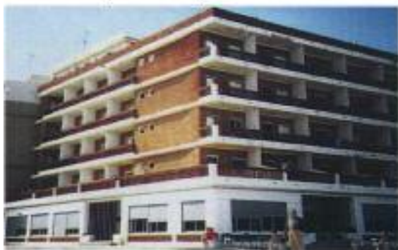
RESIDENCIA "ARIANE" Playa Mareny de Vilches

Información y solicitudes en Plaza del Negrito 3 y 4. 46001 VALENCIA. Tel. 963 91 27 90 | Correo electrónico: hermandadesvalencia@hotmail.com