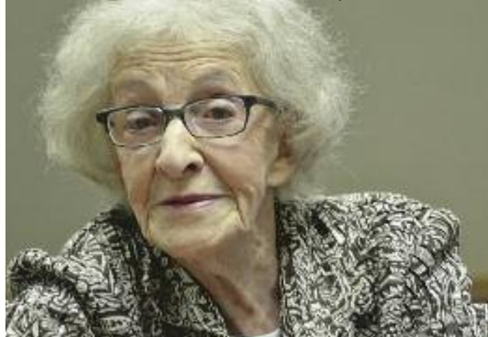
Ida Vitale en la Universidad A&M de Texas

un encuentro entre una exacerbada percepción sensorial de raíz simbolista, siempre atenta al mundo natural, y la cristalización conceptual en su perfil más preciso. Ella misma ha afirmado sobre la naturaleza de la búsqueda del poeta: "Las palabras son nómadas; la mala poesía las vuelve sedentarias". Es representante de la poesía esencialista. Su obra está caracterizada por poemas cortos, una búsqueda del sentido de las palabras y un carácter metaliterario.