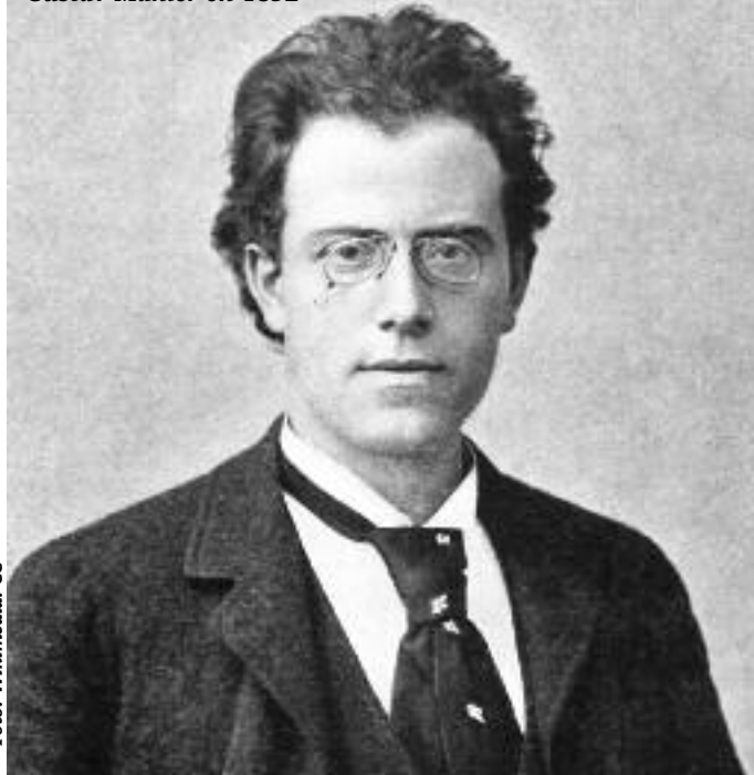
Gustav Mahler en 1892

Al día siguiente, interpretaron la Sinfonía nº 11 de Shostakovich con acierto total y extraordinario éxito, igual que el día anterior, pero en este caso mucho más justificado. Se vio que director y músicos sienten y viven la Sinfonía con mucha intensidad y emotiva expresión. Mahler es precursor de ampliar las posibilidades de la orquesta y de dar mayor importancia a la percusión, con todo tipo de instrumentos. Shostakovich hereda con provecho estas innovaciones y construye sus sinfonías a gran orquesta, a deslumbrante percusión. No llega a la Sinfonía de los "1000", pero casi. Porque suenan regimientos, batallas, matanzas y revoluciones. La