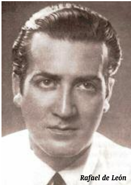
Rafael de León

En definitiva, Rafael de León puso en verso la historia sentimental de varias generaciones, y sin embargo no ha sido reconocido con la justicia que merece su delicadeza en el verso y sus metáforas puras que no tienen nada que envidiar al universo metafórico lorquiano. Su obra está a mitad de camino de la poética culta y la popular, pero como representación del espectáculo musical de evasión de una época, es fundamental para entender el fenómeno del gusto popular. Nadie como él utilizó un código de personajes y acciones con tanta capacidad poética y comercial.