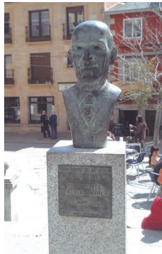
Busto Vicente Aleixandre, Miraflores de la Sierra, Madrid

Sus primeras obras presentan huellas de Bécquer y Darío, los grandes maestros vivos que les sirven como guías (Juan Ramón Jiménez y Antonio Machado) y la poderosa atracción de la