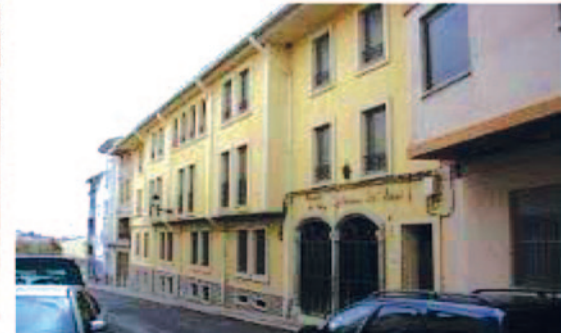
RESIDENCIA "LOS CLOTICOS" Sierra de Espadán