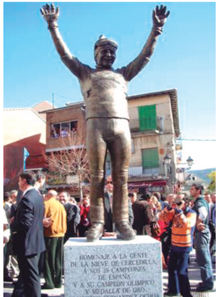
Estatua de Paquito Fernández Ochoa en Cercedilla (Madrid).

La veo fotografiada con un balón entre las