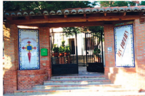
RESIDENCIA "LES FORQUES" Sierra la Calderona