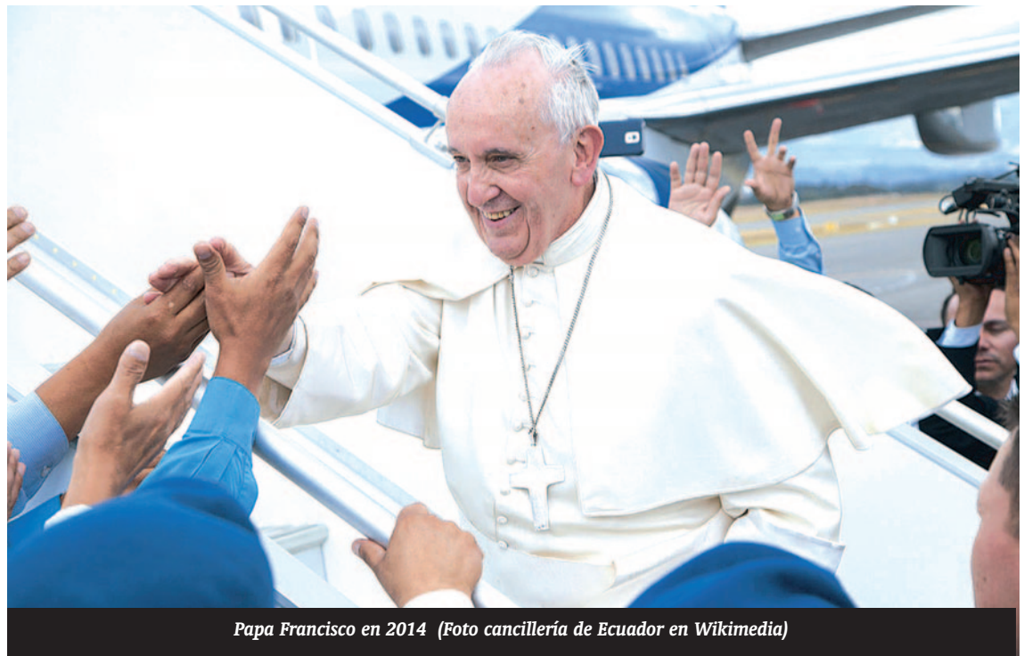
Papa Francisco en 2014

La historia viene de lejos, y solo Juan XXIII, en nuestra opinión, intentó mejorar la situación con el Concilio Vaticano II. Pablo VI con