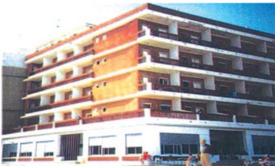
RESIDENCIA "ARIANE" Playa Mareny de Vilches