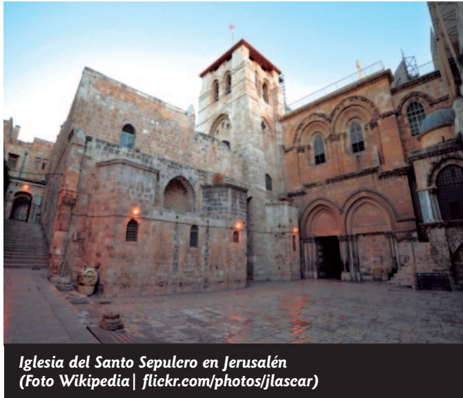
Iglesia del Santo Sepulcro en Jerusalén

La tradición del sepulcro vacío es antigua, como demuestra el texto que introduce Mateo en su evangelio: «A la mañana siguiente, pasado el día de la Preparación, acudieron en grupo los sumos sacerdotes y los fariseos a Pilato y le dijeron: “Señor, nos hemos acordado de que aquel impostor, estando en vida, anunció: ‘A los tres días resucitaré’. Por eso ordena que vigilen el sepulcro hasta el tercer día, no sea que vayan sus discípulos, se lleven el cuerpo y digan al pueblo: ‘Ha resucitado de entre los muertos’. La última impostura sería peor que la primera”. Pilato contestó: “Ahí tenéis la guardia: id vosotros y asegurad la vigilancia como sabéis”. Ellos aseguraron el sepulcro, sellando la piedra y