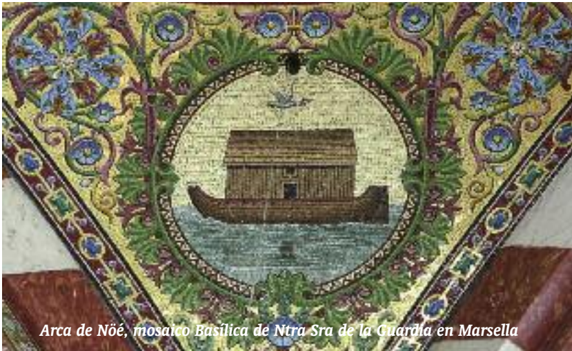
Arca de Nôé, mosaico Basílica de Ntra Sra de la Guardia en Marsella