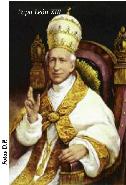
Papa León XIII