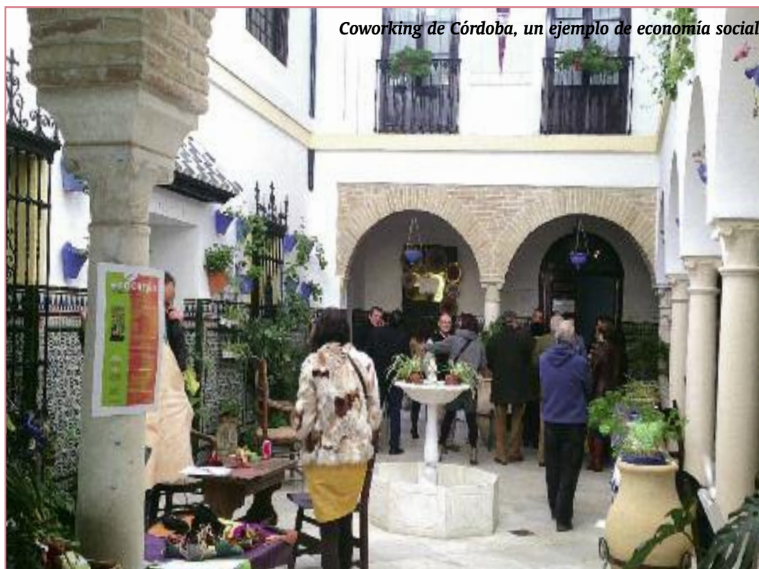
Coworking de Córdoba, un ejemplo de economía social

La tradicional Fiesta del Trabajo es un buen momento para renovar la vocación de las Hermandades del Trabajo, una asociación de laicos al servicio de la Iglesia católica en el ámbito de la acción apostólico-social en pro de los trabajadores. Este era el medio que utilizaron los fundadores desde nuestro nacimiento en 1947, para conseguir los fines que perseguían: en lo temporal, la mejora de las condiciones sociales y económicas de vida; incluidas las culturales; en lo espiritual, la cristianización del mundo del trabajo, auténtico carisma que el fundador Abundio García Román vino a introducir en la iglesia española de la época, por sus experiencias vitales vividas en los difíciles años treinta.