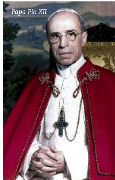
Papa Pío XII