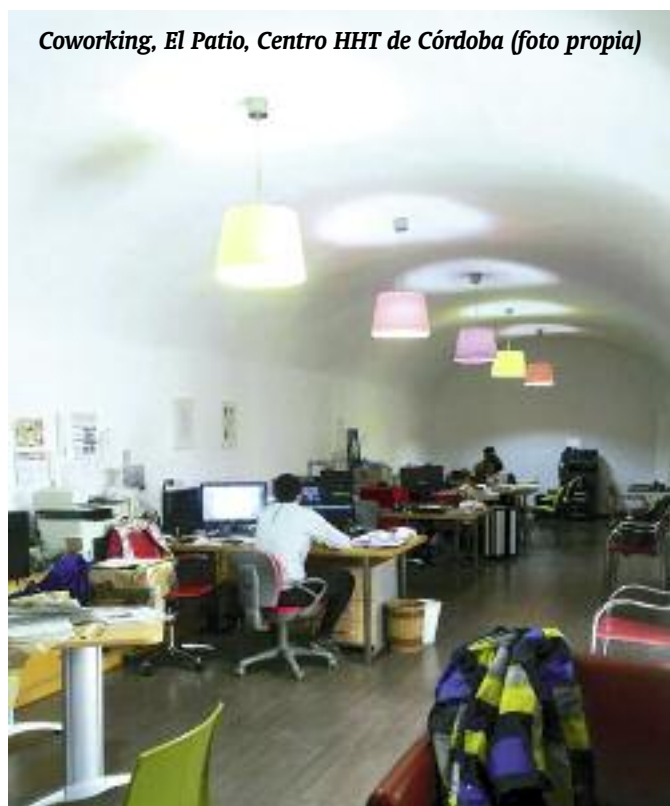
Coworking, El Patio, Centro HHT de Córdoba

En el patio de la casa Santo Dios se llevaba a cabo diariamente como parte de la vida familiar una relación profesional. Estaban entre