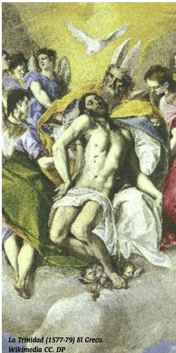
La Trinidad (1577-79) El Greco.

Aparición de Jesús en Tiberíades. Una aparición muy bonita que aparece en el capítulo 21 de san Juan... Después de la pesca y comida, Jesús toma aparte a Pedro y le dice: ‘Simón Pedro, ¿tú me amas más que éstos?’. Pedro se ve comprometido, recuerda su negación en la noche del Jueves Santo en casa de Caifás y titubea un poco, pero al fin basándose en la ciencia de Jesús, decide: ‘Tú sabes todo. Tú sabes que yo te quiero’. ‘Apacienta mis rebaños’. Y así tres veces. Jesús entroniza a Pedro como cabeza del colegio apostólico, y por eso Jesús le da la jerarquía. Jerarquía quiere decir autoridad sagrada; apacienta, gobierna, enseña. La verdad está en Cristo y su vicario. La Iglesia triunfa. Si hubiera sido obra de hombres, ya no habría Iglesia hoy día. Porque es obra de Dios, perenne, eterna, habrá Iglesia, que hoy es militante y mañana será triunfante.