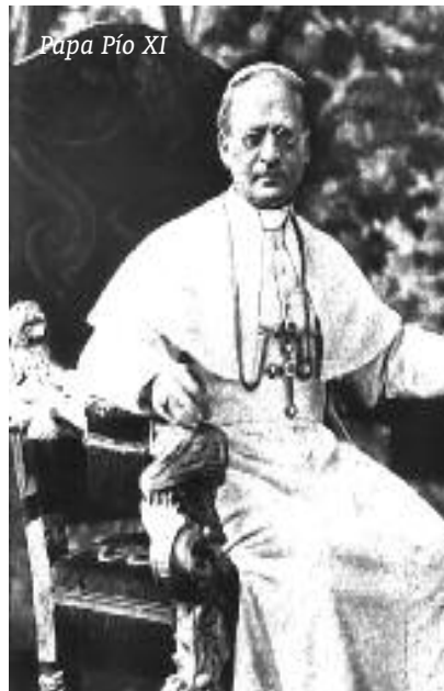
Papa Pío XI