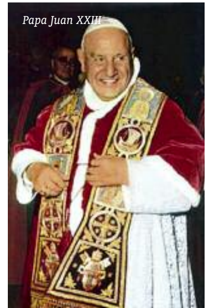
Papa Juan XXIII