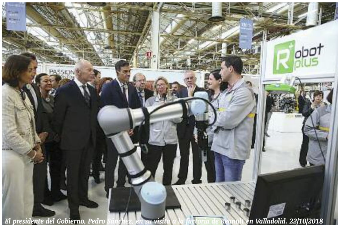
El presidente del Gobierno, Pedro Sánchez, en su visita a la factoría de Renault en Valladolid. 22/10/2018