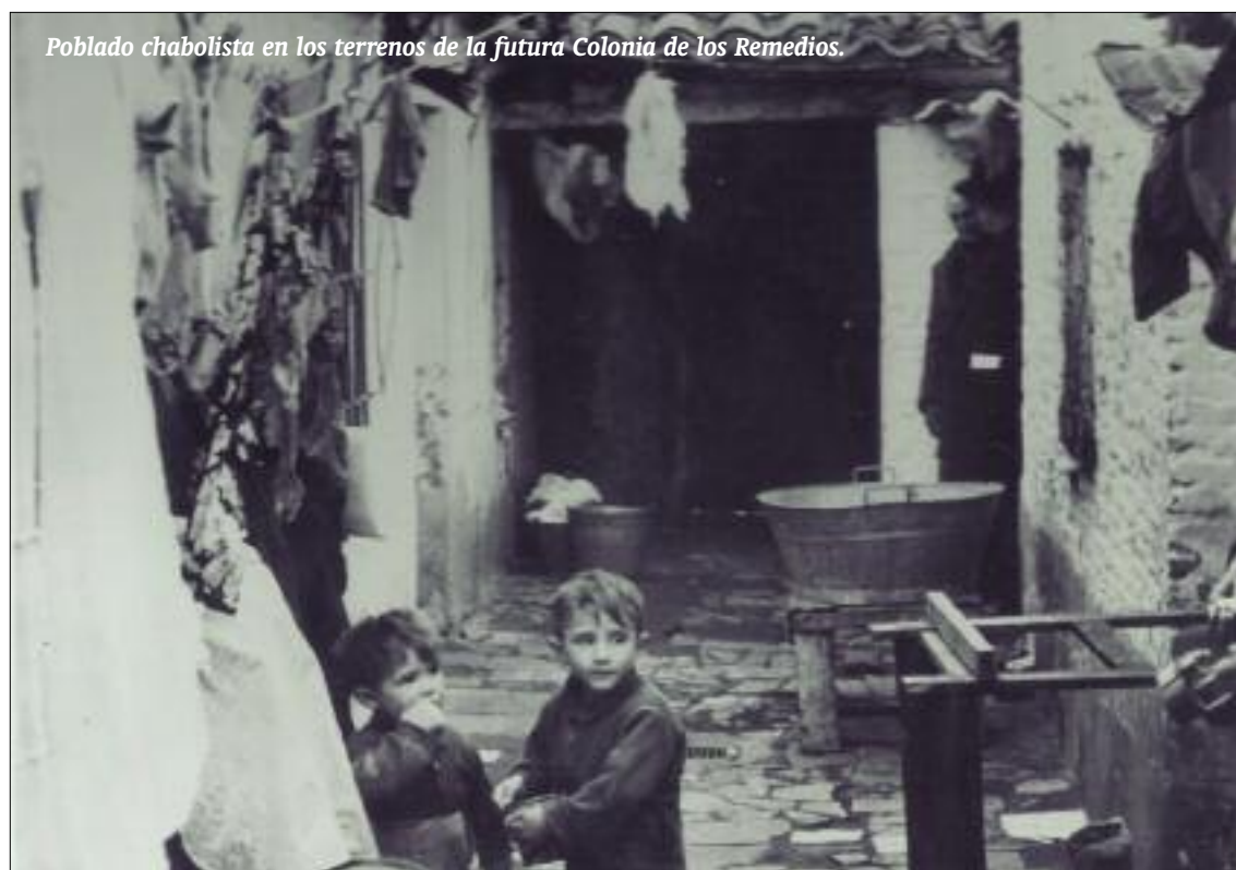
Poblado chabolista en los terrenos de la futura Colonia de los Remedios.

Pero al hilo de la figura de este sacerdote diocesano de Madrid, nacido en Extremadura (19/12/1906) e inmigrante en Madrid a los 7 años entendemos mejor como ha sido la historia.