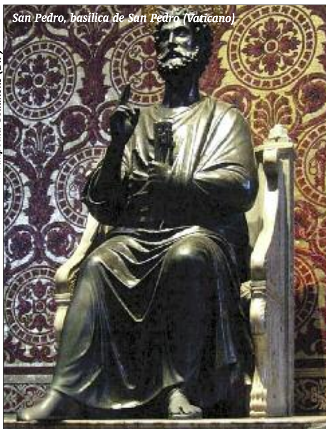
San Pedro, basílica de San Pedro (Vaticano)

En todo caso, este mismo pasaje del capítulo 21 del cuarto evangelio es importante para destacar un aspecto literario-teológico de la figura