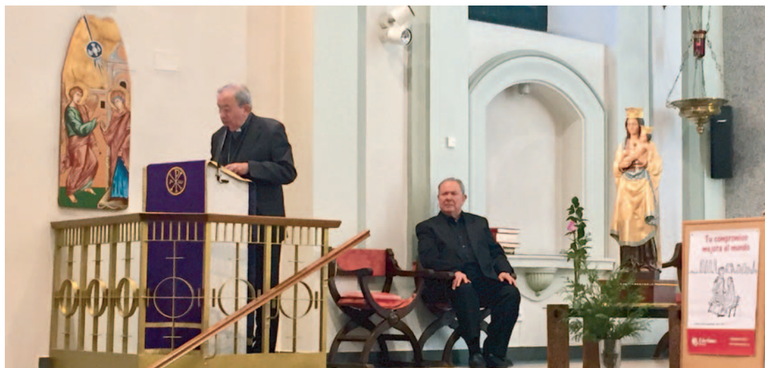
Monseñor Antonio Algora en un momento del Pregón de Navidad

Como alguna intranquilidad debe de quedar en este tipo de personas, el argumento definitivo para desautorizar 20 siglos de cristianismo en Europa es afirmar algo más histórico, más anterior: las culturas griega y romana que esas