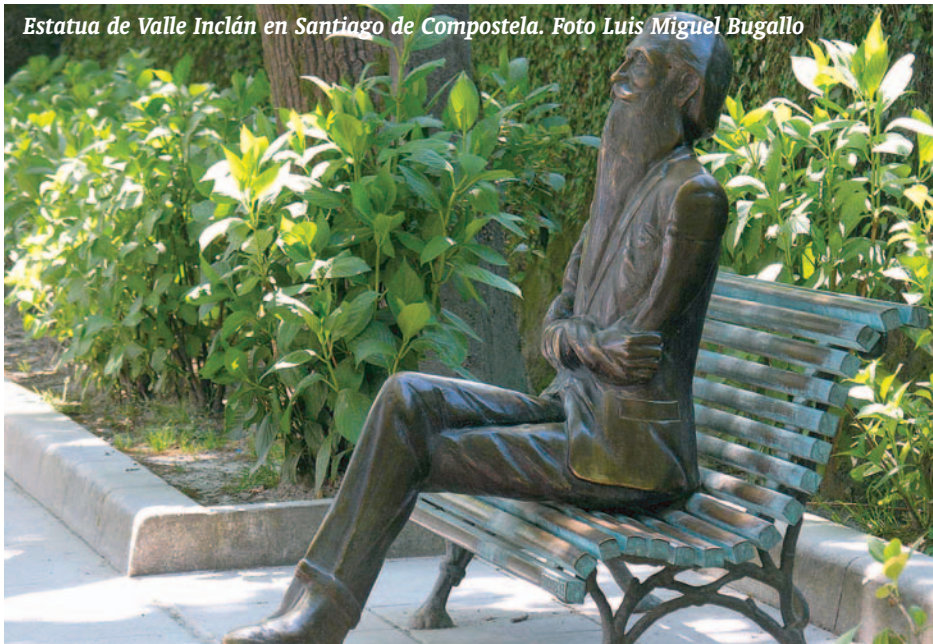
Estatua de Valle Inclán en Santiago de Compostela.

cada y lo irreal oculta lo real. Dentro de este género destaca Luces de Bohemia . Se trata de un esperpento trágico sobre la vida literaria en la sociedad española. El protagonista, Max Estrella, sale por la mañana de su casa para reclamar que le paguen más por la novela que ha vendido Don Latino. No logran mejorar el precio y terminan en una taberna emborrachándose.