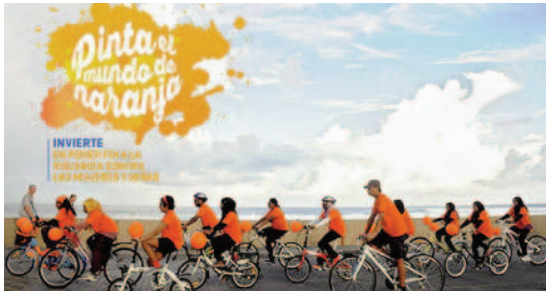
Cartel del Día Internacional de la Eliminación de la Violencia contra la Mujer 2017, de la UNESCO

El feminismo como movimiento social, con un vuelco pendular en lo que respecta a las féminas, desde la pasividad a la agresividad; como movimiento de masas con presencia incluso en la calle, no se desarrolla hasta después de Mayo del 68; en especial en la década de los 70, que es cuando se crean asociaciones feministas. Lejos queda la frasecita tan difundida