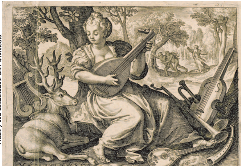
Adán y Eva condenados.

Desde la perspectiva del relato, crear es poner orden en una situación caótica: tohu y bohu , «[tierra] informe y vacía», a la que se añade la oscuridad sobre la faz del abismo ( tehom , que suena pare-